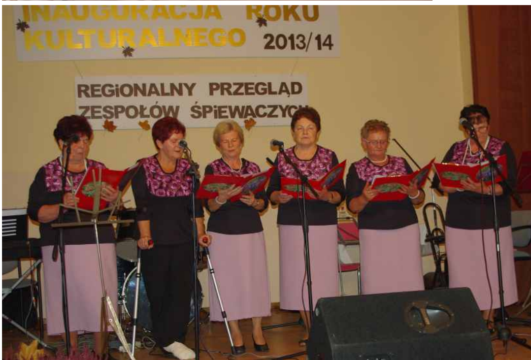
🕒 Kolejny rok kulturalny zespół rozpoczął w zmniejszonym składzie spowodowanym chorobami i kontuzjami. Lubasz, 25. 10. 2013