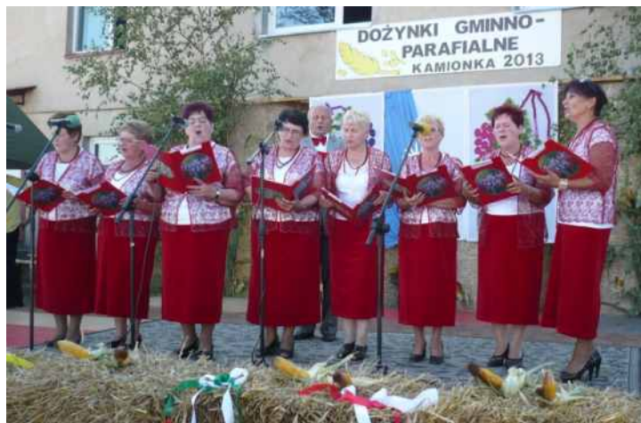
Dożynkowy występ 🕒