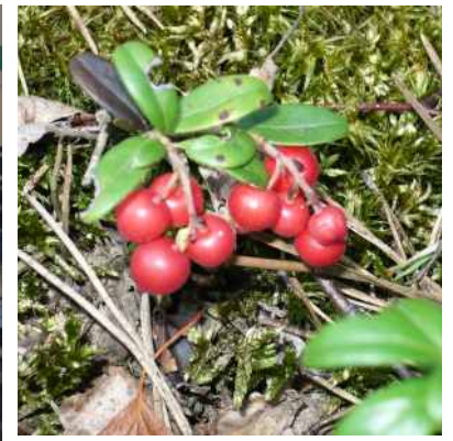
📍 Noc świętojańska – 22.06.2013