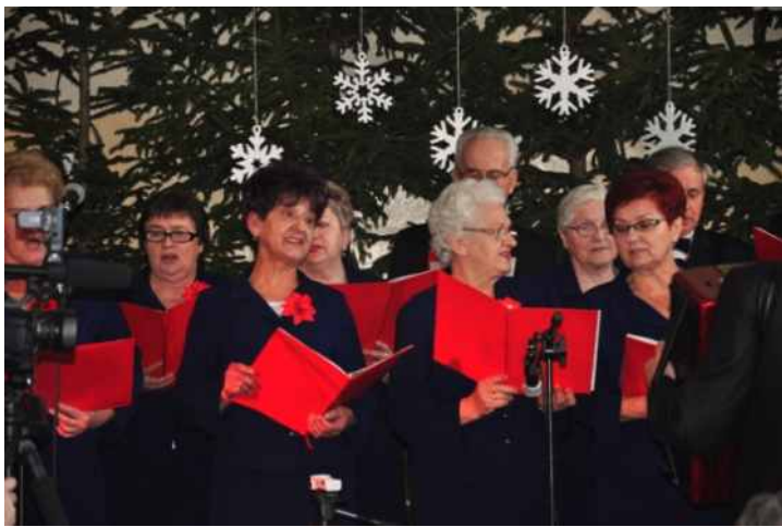
🕒 PRZEMYSŁAW II z Rogoźna