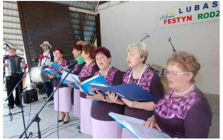
📍 Lubaski wiejsko-parafialny festyn rodzinny – 2.06.2013