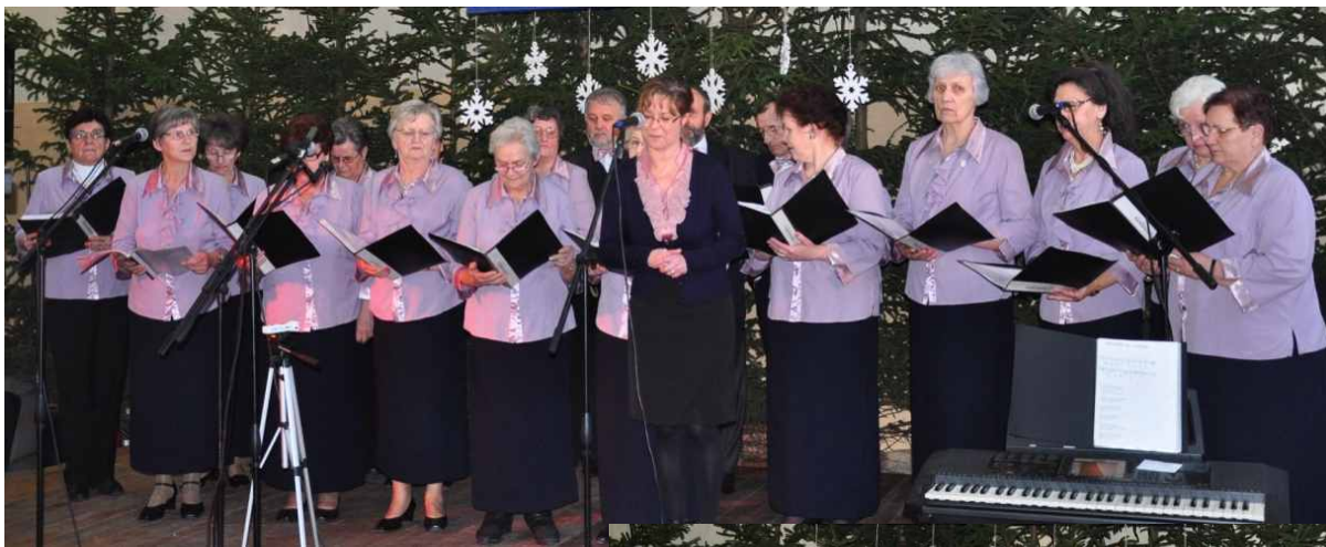
⌚ GOŚLINIANKI z Murowanej Gośliny