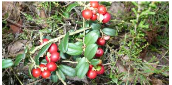
🕒 OSTROROSKIE JAŚKI z Ostrorogu