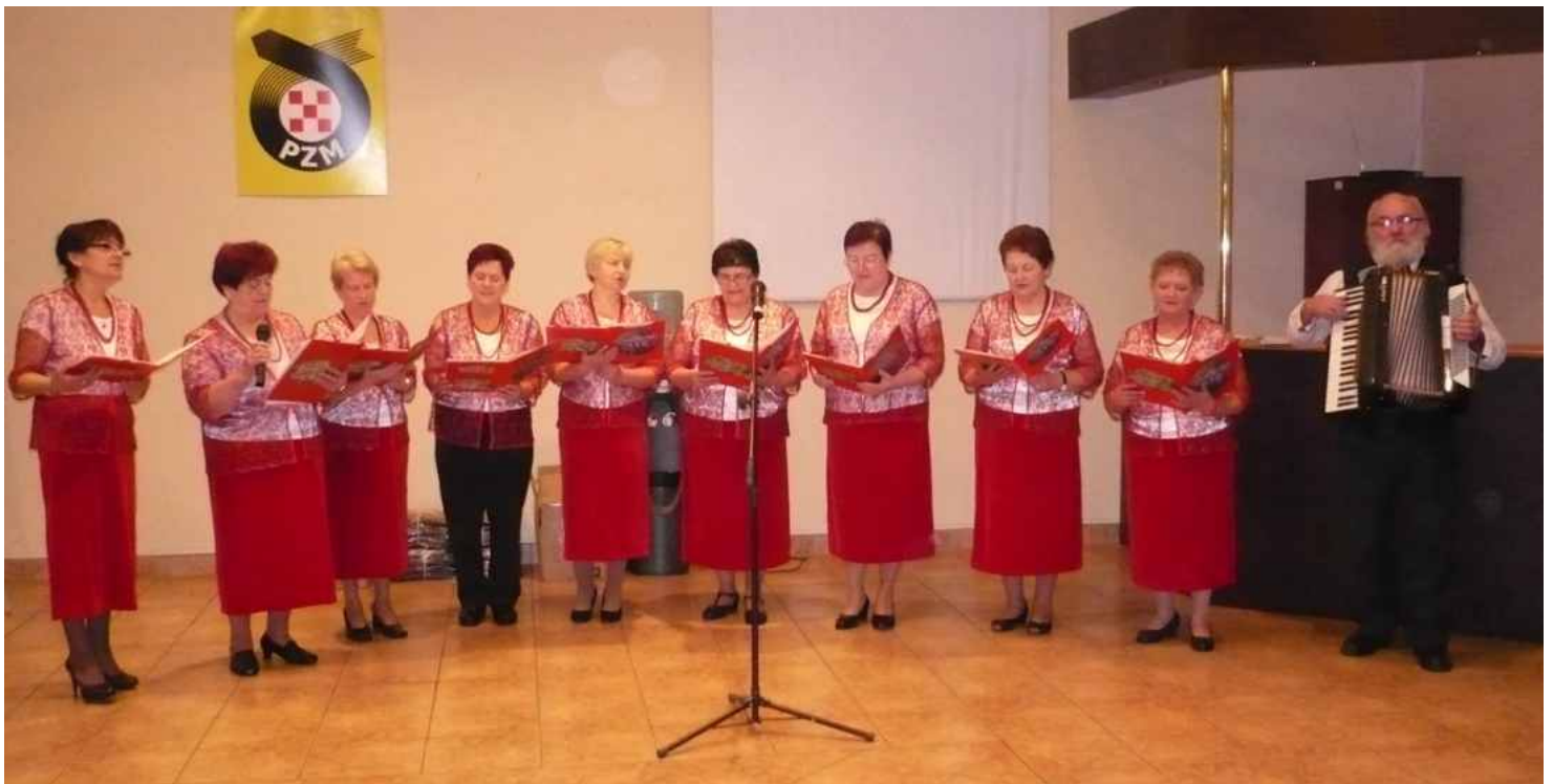
🕒 Koncertowanie na zakończenie rajdu samochodowego z okazji Dnia Niepodległości w Wielkopolskim Automobilklubie Poznańskim – 7. 11. 2013