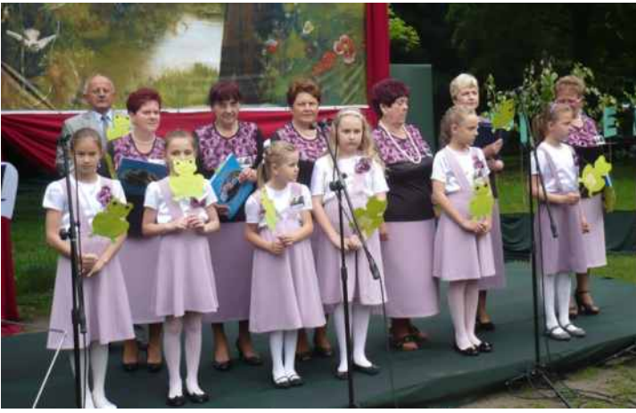
📍 Festiwal Piosenki Seniorów - Szamotuły 28.05.2013