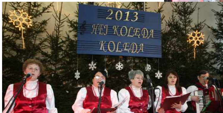
⌚ GOŚCINIANKI z Gościejewa