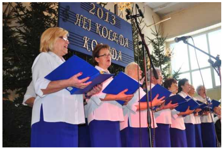
🕒 CHABRY z Wroniek