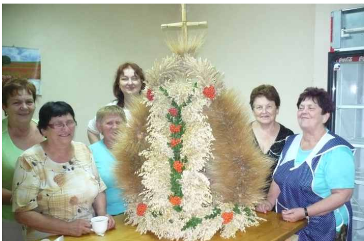
🕒 Własnoręcznie upleciony wieniec dożynkowy ...