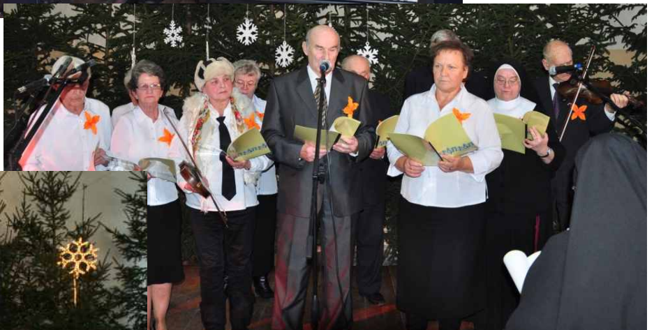
BETLEJEMKA z Szamotuł ➡